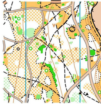
СХЕМА АРЕН ЗМАГАНЬ.